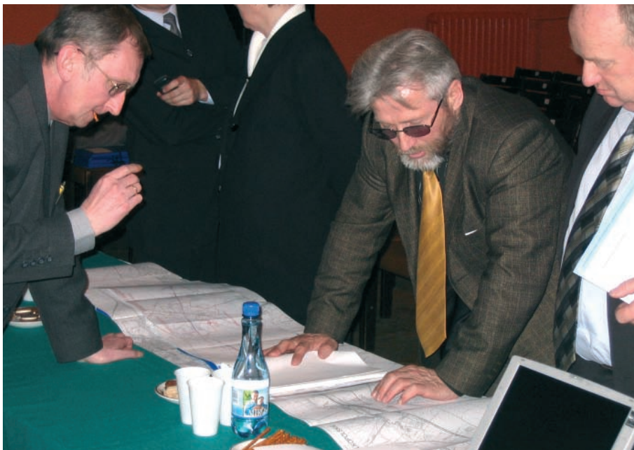
Dyskusja z projektantem daje lepsze efekty, niż najlepiej umotywowane uwagi pisemne

są zazwyczaj inwestycje liniowe - kolejowe czy drogowe, prowadzenie konsultacji społecznych w sposób otwarty i aktywny po prostu się opłaca. Przy planowanych wydatkach na modernizację konsultowanego odcinka linii E59 rzędu 640 mln złotych, organizacja omówionych konsultacji społecznych kosztowała jedynie 11 tys. złotych (nie licząc kosztów uczestnictwa w spotkaniach projektantów i inwestorów). To znacznie mniej niż promil planowanych do poniesienia kosztów. Ale nawet jeśli koszty te miałyby wynieść 1% kosztów przygotowania i realizacji inwestycji, jest to naprawdę mała cena za obniżenie ryzyka pojawienia się dokuczliwych protestów społecznych, jeśli konsultacje nie były prowadzone lub były minimalne.