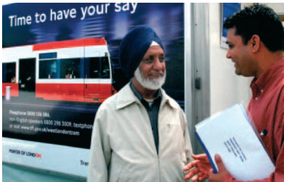
Transport for London

Wstępną decyzję o budowie i przebiegu WLT podjął burmistrz Londynu w 2002 roku. WLT ma mieć 20 km długości, 45 przystanków i łączyć Sheperd's Bush w zachodnim Londynie z peryferyjną dzielnicą Uxbridge, przebiegając przez Acton, Ealing, Hanwell, Southall. Projekt od razu uzyskał pełne poparcie władz lokalnych dzielnic. Aby zyskać informację o stosunku społeczeństwa do inwestycji prowadzono szeroko zakrojone konsultacje społeczne.