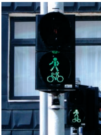
Wspólny sygnalizator dla pieszych i rowerów w Elku.

Bardzo często budowa drogi dla rowerów wykorzystywana jest jako okazja do gruntownych remontów sygnalizacji świetlnej na skrzyżowaniach, przez które przebiega ścieżka. Pod pretekstem konieczności