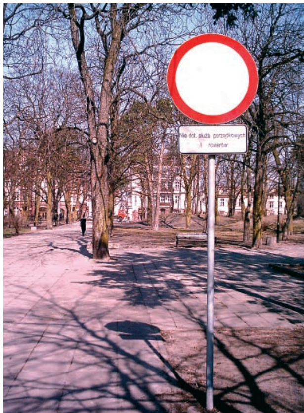
Wkrótce wiosna

Wspólne sygnalizatory pieszo-rowerowe popularne są np. w Wiedniu, gdyż oszczędni Austriacy liczą się z pieniędzmi. W bogatej i rozrzutnej Polsce wspólne sygnalizatory są wciąż rzadkością, ale można je już zaobserwować np. na ulicach Elku. Warto spopularyzować to proste i oszczędne rozwiązanie. Zamiast topić kilkaset tysięcy złotych w nowe światełka, lepiej wybudować dłuższą ścieżkę lub dokonać niezbędnych korekt geometrii skrzyżowań.