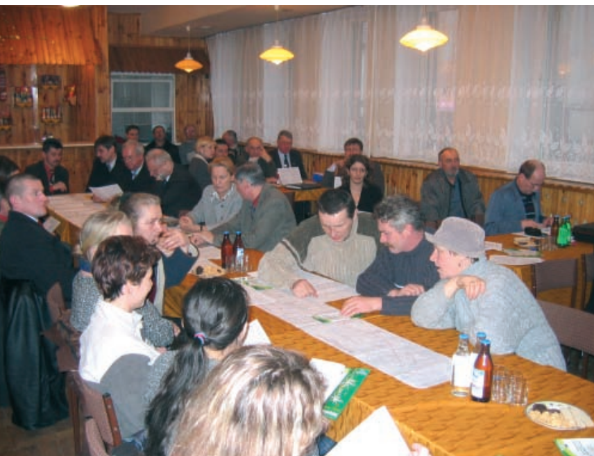
Pełna sala podczas spotkania konsultacyjnego z Żmigrodzie

Aby zaprosić zainteresowanych na spotkania konsultacyjne postawiono na bezpośredni, nieodgraniczony dostęp do informacji. Plakaty i ogłoszenia z dodatkową informacją o spotkaniach konsultacyjnych rozwieszono nie tylko w urzędach jednostek samorządowych i na stacjach kolejowych, ale wszędzie gdzie tylko to było możliwe, np. na słupach ogłoszeniowych czy w sklepach. Samorządy oraz najważniejsze organizacje ekologiczne i społeczne z regionu