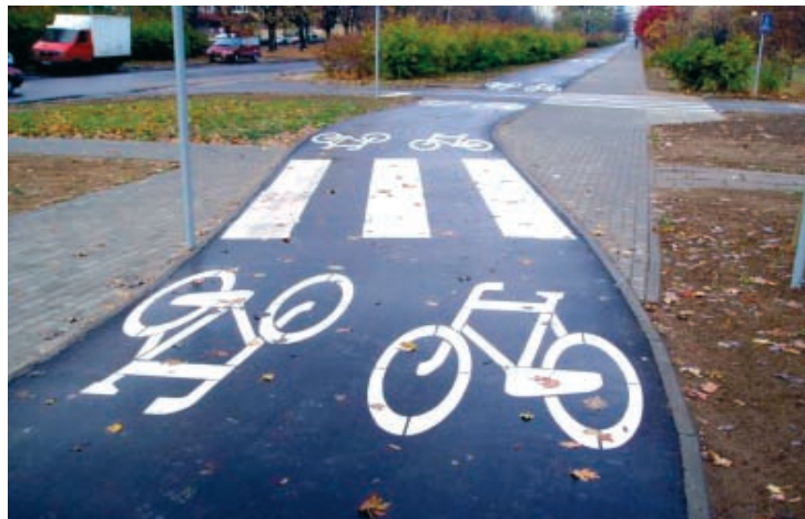
Droga rowerowa z czarnego asfaltu wzdłuż ulicy Wyszogrodzkiej.

Na warszawskim Bródnie (dzielnica Targówek) przy ul. Chodeckiej i Wyszogrodzkiej zostały oddane do użytku dwie nowe drogi dla rowerów. Wśród innych stołecznych ścieżek wyróżniają się równą asfaltową nawierzchnią i łagodnymi wyłukowaniami. Jest to efekt skonsultowania projektu ze Społecznym Rzecznikiem Niezmotoryzowanych i zastosowania opracowanych przez „Zielone Mazowsze” standardów technicznych dla infrastruktury rowerowej. Wprawdzie nie wszystkie uwagi cyklistów zostały uwzględnione przez drogowców - na zdjęciu widać np. znak umieszczony zbyt blisko